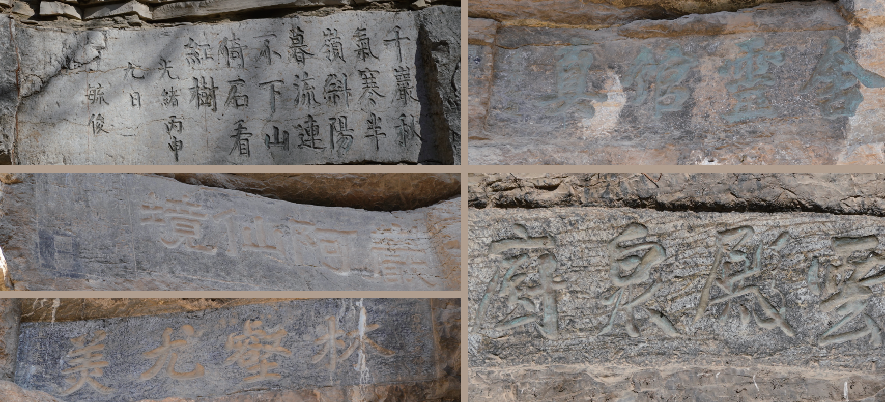
图 6 部分摩崖石刻