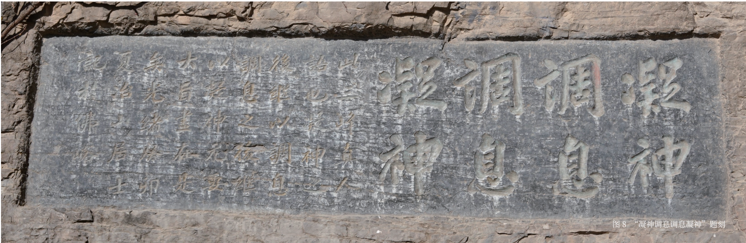
图8 “凝神调息调息凝神”题刻