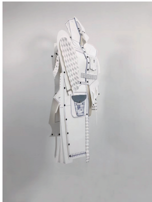
图2 同一结构的若干种折叠方式(一)