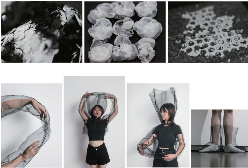
图 11 第二皮肤