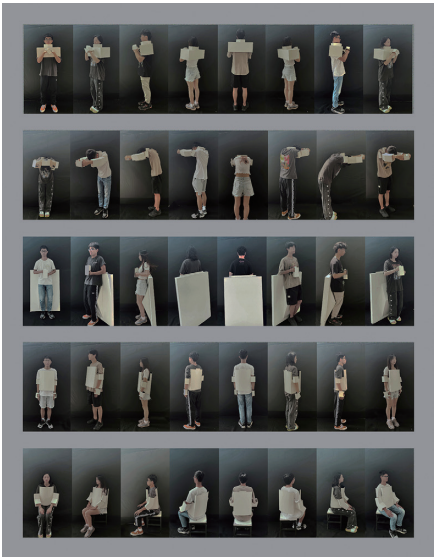
11 12 13

的“像”，我们借由身体来展示衣服，也通过衣服来更为客观地了解自己的身体。然而，衣服一旦脱离身体，除了折叠或悬挂于衣架，还有别的存在方式吗？学习并引入当代艺术的表现形式，思考并尝试“衣服”在脱离主体（身体）之后展示的诸种可能性。（图 10）