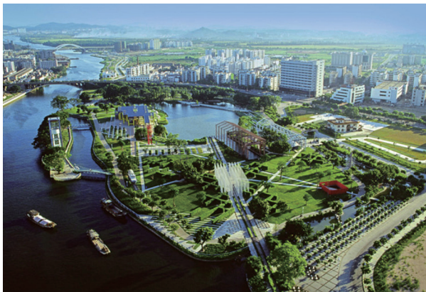
图4 中山岐江公园鸟瞰图