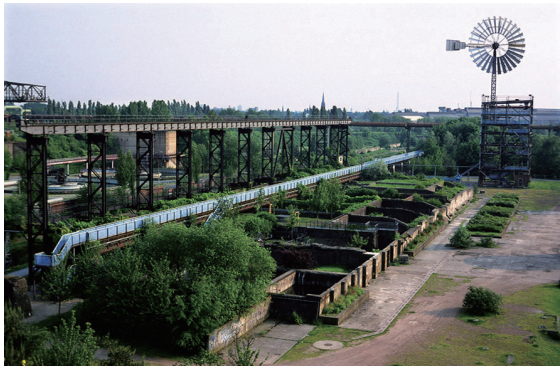
图2 北杜伊斯堡公园熔渣园改造后