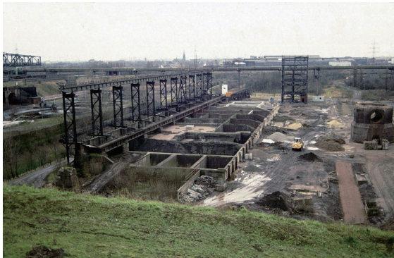
图1 北杜伊斯堡公园熔渣园改造前