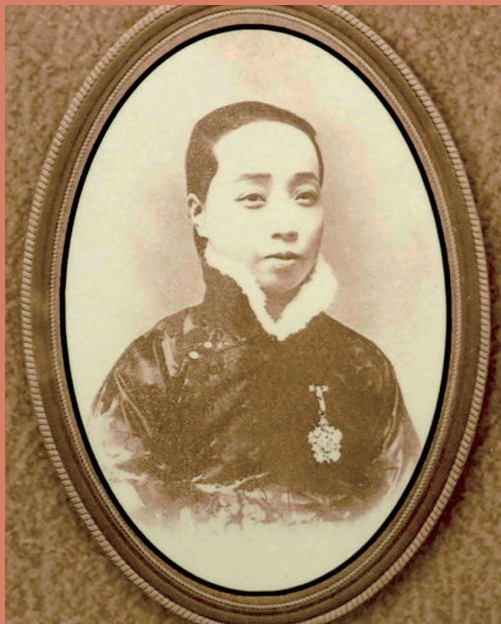
图2 沈寿像