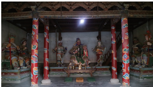
图 13 春秋楼内彩塑