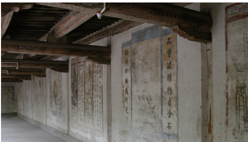
图 14 看楼壁画