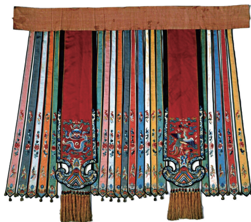
图5 龙凤花卉蝶纹凤尾裙(清)

行穿着。凤尾裙的制作一般采用的是真丝面料，但是由于穿着时会因上身的遮挡而导致上半部分的花纹不显露，所以在制作的过程中更加注重对裙身下半部分的制作。裙幅在制作的过程中，一般采用的是棉麻的材质。棉麻面料在上，用袄衫进行遮盖，真丝的面料在下，是展现风采的部分，所以一般会绣上较为华丽的图案。在凤尾裙的制作当中，刺绣的部分一般采用真丝织物进行制作，在装饰物的选择上也大多采用丝织品，通过传统的滚边、立体花卉刺绣等手法，在珍贵的面料当中进行更加精细的手工制作，使得裙子的整体价值提升。凤尾裙的裙衬部分大多采用的是棉麻面料。较为富贵的人家在制作当中会采用丝绸面料进行制作，在行走的过程中，带有暗纹的绸缎内衬会展露出来，与漂亮的条带，形成一幅美丽的画面。(图4)