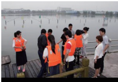
珍珠产业市场调研

构建具有苏州特色的产教融合模式，推动高职院校和产业发展，需要统筹“产”“教”双方，找寻两者之间的平衡方式。但目前，苏州地区的传统文化产业与高职艺术设计专业的产教合作存在问题。