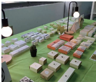
渭塘珍珠包装设计