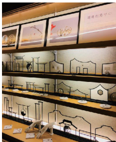
苏州地区珍珠文创产品线销售展示场景