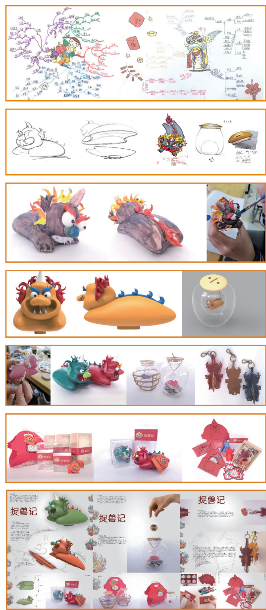
2 图2、春节主题思维导图 3 图3、草图构思 4 图4、方案草模 5 图5、计算机辅助设计 6 图6、实物模型制作 7 图7、产品包装设计与制作 8 图8、产品设计展板