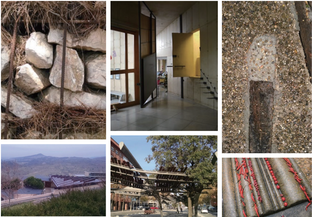
图 8、伊瓜拉达墓园——在混凝土坟墓盖上留下的水果

园埋于土下的较低的部分，其被石笼挡土墙和陵墓一样的墓地所包围，在一个有顶的入口，光线通过眼孔穿过混凝土墙和地板，在一天不同的时刻中改变空间的感官（图 2）。