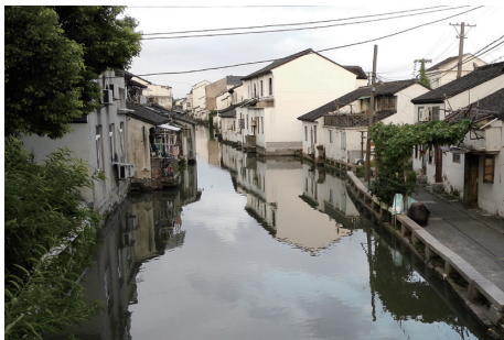
图 7、桃花坞下塘河“一河无街”式水巷景观