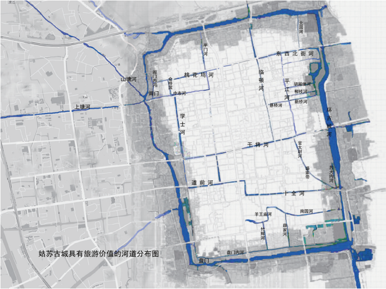
图 2、姑苏古城具有旅游价值的河道分布图（自绘）