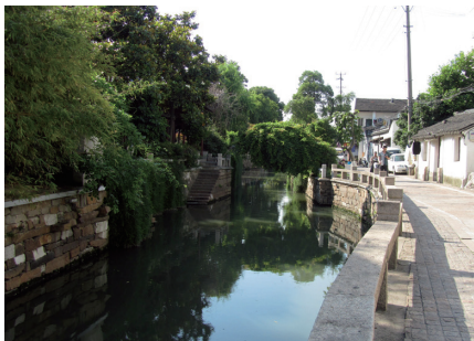
图 6、望星桥堍“一河两街”式水巷景观