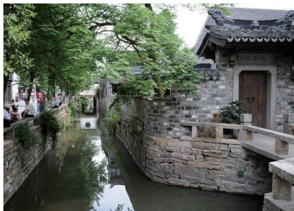
图 5、平江路“一河一街”式水巷景观